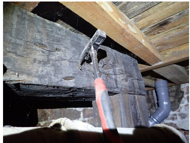
Bilder 9 und 10: Ein Sprengwerk fällt durch seinen schwärzlichen Anstrich auf.