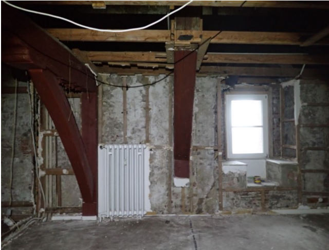
Bilder 11 bis 13: übersicht. Stützen sind in zwei Ebenen angeordnet