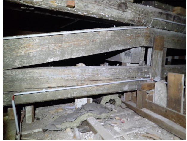
Bilder 7 und 8: Übersicht: Stahlträger und Sprengwerke (Nadelholz) bilden das Deckentragwerk